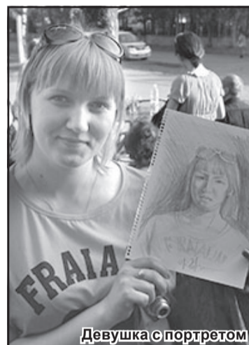
Девушка с портретом