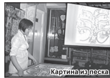
Картина из песка

До 9 часов вечера продолжалась акция. Наши односельчане возвращались домой в приподнятом настроении и не с пустыми руками: многие с сувенирами, батиками. А две девушки – с собственными портретами – по-