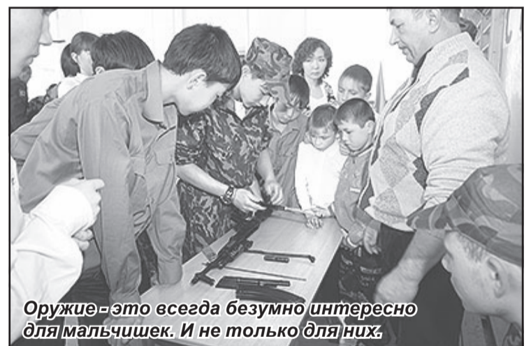
Оружие - это всегда безумно интересно для мальчишек. И не только для них.