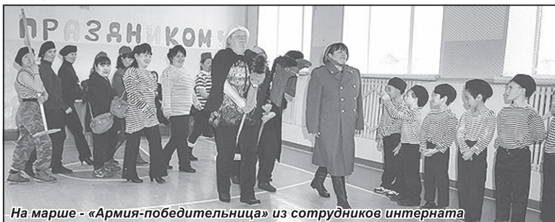
На марше - «Армия-победительница» из сотрудников интерната