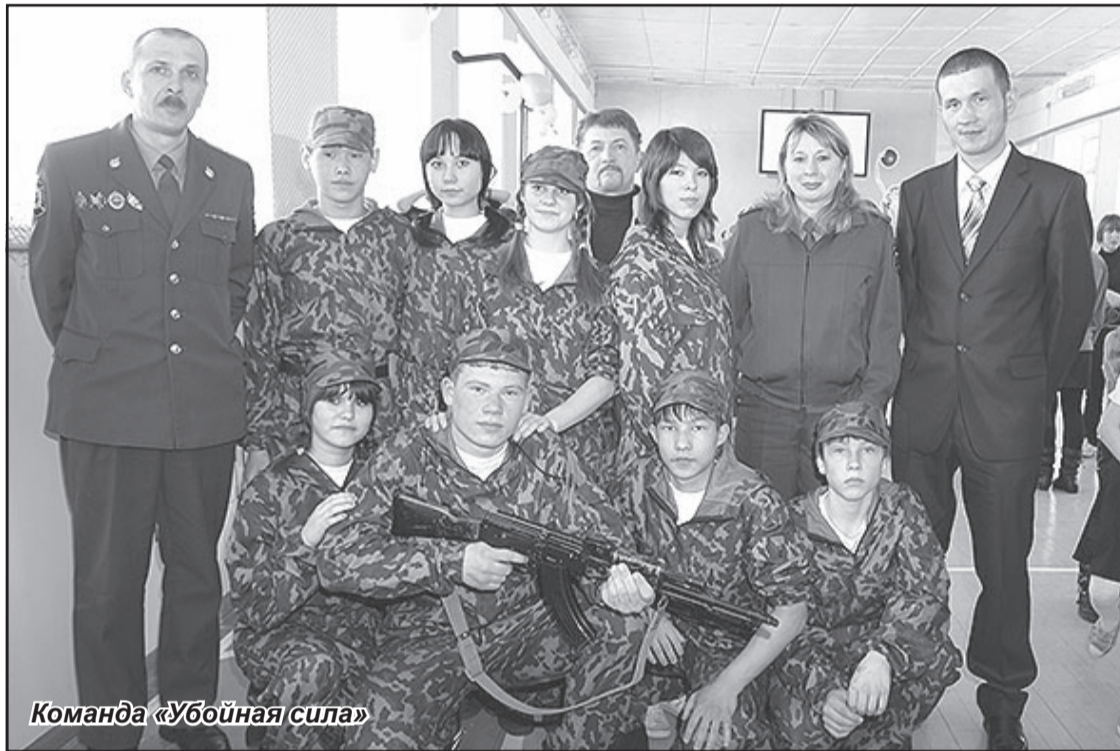
Команда «Убойная сила»

«БЕЗОПАСНОСТЬ РОССИИ ЗАВИСИТ ОТ НАС, БЕЗОПАСНОСТЬ, И МИР НА ПЛАНЕТЕ!»