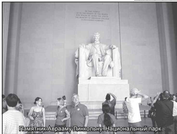
Памятник Аврааму Линколу. Национальный парк

Население страны относится к заповедным территориям с трепетом, уважением и гордостью, это отчасти обусловлено тем, что любой объект исторического, культурного или природного наследия является национальным парком, ну и конечно, законопослушностью и культурой самих граждан.