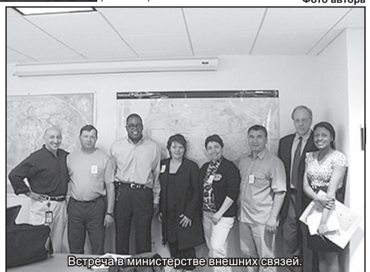
Встреча в министерстве внешних связей.