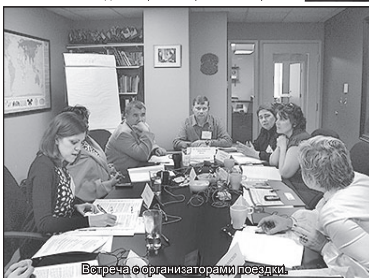
Встреча с организаторами поездки.

зации мониторинга. Положительный опыт в развитой инфраструктуре, обслуживании посетителей, на всех территориях парков США около 28 тысяч объектов предназначенных для обслуживания посетителей. Их услугами в год пользуется около 285 миллионов человек. Всей этой работой занимаются не принадлежащие парку компании на основании разных форм договоров и получающие за услуги доход, это хорошо только при достаточном бюджетном финансировании. Например, национальные парки Аляски, занимающие по площади 2/3 от всех парков штатов, в год получают бюджетных денег около 75 миллионов долларов, в то время как доход от посетителей составляет около 11 миллионов и все это на 600 человек постоянно работающих и 500 привлеченных в лет-