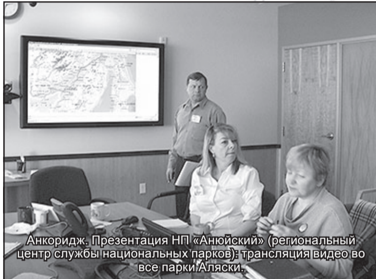
Анкоридж. Презентация НП «Аньюйский» (региональный центр службы национальных парков): трансляция видео во все парки Аляски.

Даже отдельно стоящий памятник Джорджу Вашингтону является национальным парком, то есть местом доступным для посещения, и в то же время, особо охраняемым. Правда площадь таких парков, порой, составляет всего несколько сотен квадратных метров, может это и правильно, но мы привыкли к тому, что если национальный парк, то это большая природная территория. У каждого национального парка, так же как и в России, есть свое Положение, которое утверждается Сенатом и является законом, обязательным для исполнения всеми гражданами. Отрицательным моментом, на мой взгляд, является то, что все природные ресурсы в Америке находятся в ведении штата, на территории которого находится данный национальный парк. Это создает неразбериху как в использовании, так и в органи-