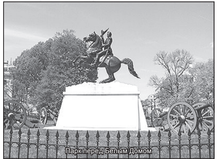
Парк перед Белым Домом

зации мониторинга. Положительный опыт в развитой инфраструктуре, обслуживании посетителей, на всех территориях парков США около 28 тысяч объектов предназначенных для обслуживания посетителей. Их услугами в год пользуется около 285 миллионов человек. Всей этой работой занимаются не принадлежащие парку компании на основании разных форм договоров и получающие за услуги доход, это хорошо только при достаточном бюджетном финансировании. Например, национальные парки Аляски, занимающие по площади 2/3 от всех парков штатов, в год получают бюджетных денег около 75 миллионов долларов, в то время как доход от посетителей составляет около 11 миллионов и все это на 600 человек постоянно работающих и 500 привлеченных в лет-